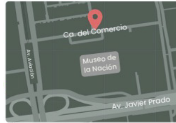
Av. Aviación con Calle del Comercio Al costado de la estación "La Cultura" del tren eléctrico