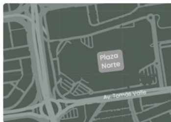
Plaza Norte – Paradero de taxis, al costado del grifo Repsol

Fecha de viaje - Nombres - Apellidos - Edad DNI - Número Telefónico - Punto de Embarque